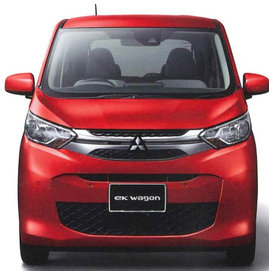
Photo:eKワゴン Joy Field-II 2WD ボディカラー:レッドメタリック ●その他のボディカラー(一部、有料色がございます)、装備・諸元につきましては、ベース車となるeKワゴン カタログをご確認ください。●写真はイメージです。●価格は消費税込 ●保険料、税金(除く消費税)、登録などに伴う費用は別途申し受けます。●リサイクル料金が別途必要となります。●メーカーオプション選択時に価格が変更になります。●一部選択できないメーカーオプションがあります。*1 価格は本体価格に加え、取付工費(1,320円)+消費税(10%)も含まれています。

0.659L DOHC 12バルブ CVT・2WD/4WD・三菱e-Assist(運転支援機能) [4人乗り]