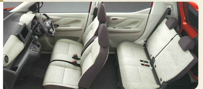
Photo: eKワゴン M 2WD ナビ取付パッケージ装着車 ボディカラー: レッドメタリック ●撮影のために点灯 ●インテリア写真はカットボディによる撮影