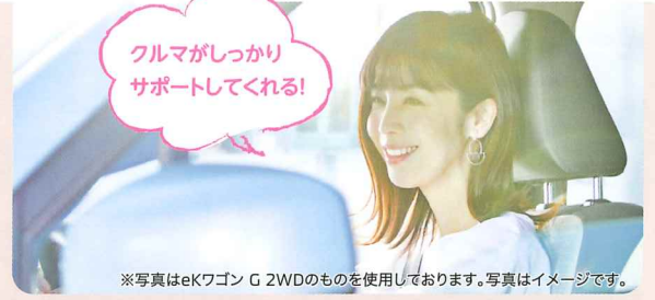
※写真はeKワゴン G 2WDのものを使用しております。写真はイメージです。

●衝突被害軽減ブレーキは、前方車両に対しては自車速が約10~80km/hのときに作動します。歩行者に対しては約10~60km/hのときに作動します。●停止保持機能がないため、停止後、約2秒でブレーキは解除されます。停止を続ける場合は、ブレーキペダルを踏んでください。●ハンドル操作やブレーキ操作による回避行動を行っているときは、作動しないまたは作動が遅れる場合があります。●FCMは、対象物、交通(急な割り込みなど)、天候(雨・雪など)、道路状況(連続するカーブなど)などの条件によっては正常に作動しない場合があります。●FCMは、前方車両と歩行者に対して作動します。二輪車などは作動対象ではありませんが、状況によって作動する場合があります。●FCMは、ドライバーの安全運転を前提としたシステムであり、運転操作の負担や衝突被害を軽減することを目的としています。システムの検知性能・制御性能には限界があるため、このシステムに頼った運転はせず、常に安全運転を心がけてください。●ご使用前に必ず取扱説明書をお読みください。